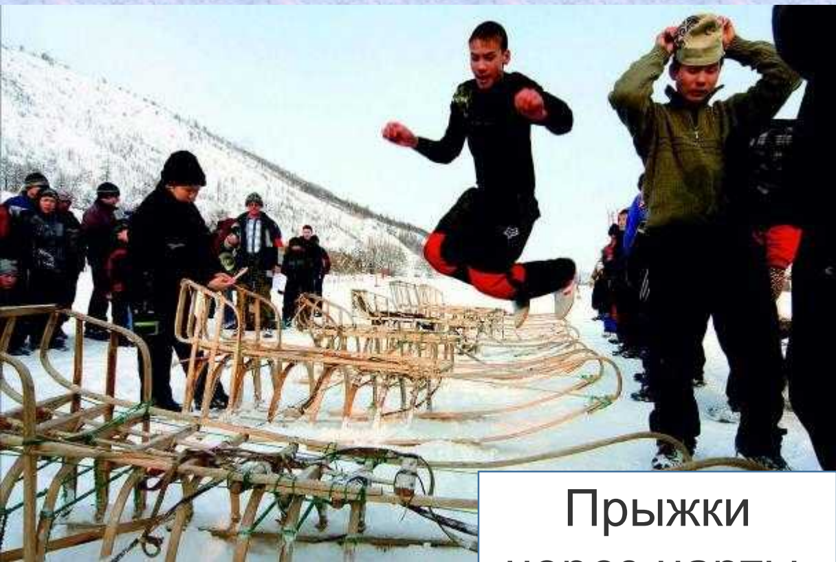
Прыжки через нарты.