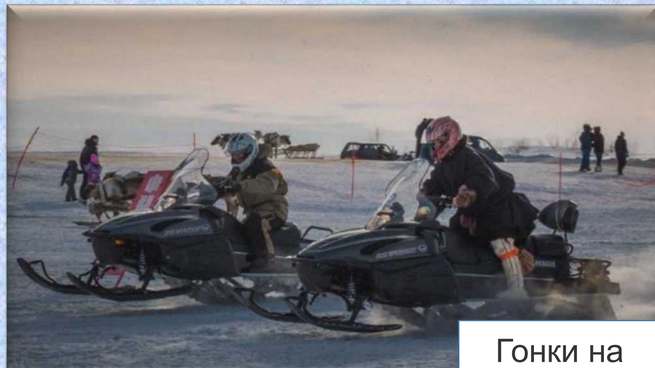
Гонки на снегоходах.