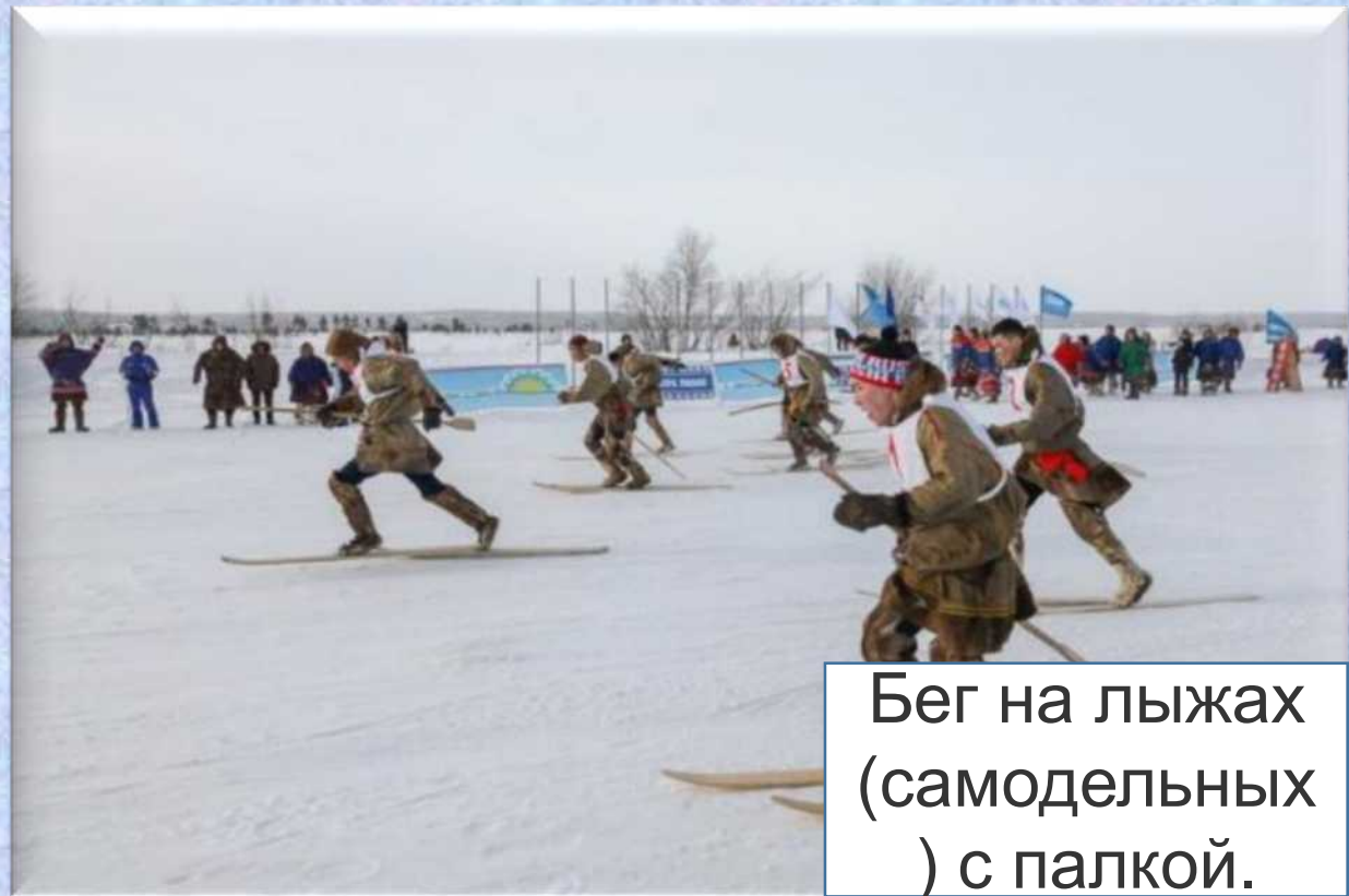
Бег на лыжах (самодельных) с палкой.