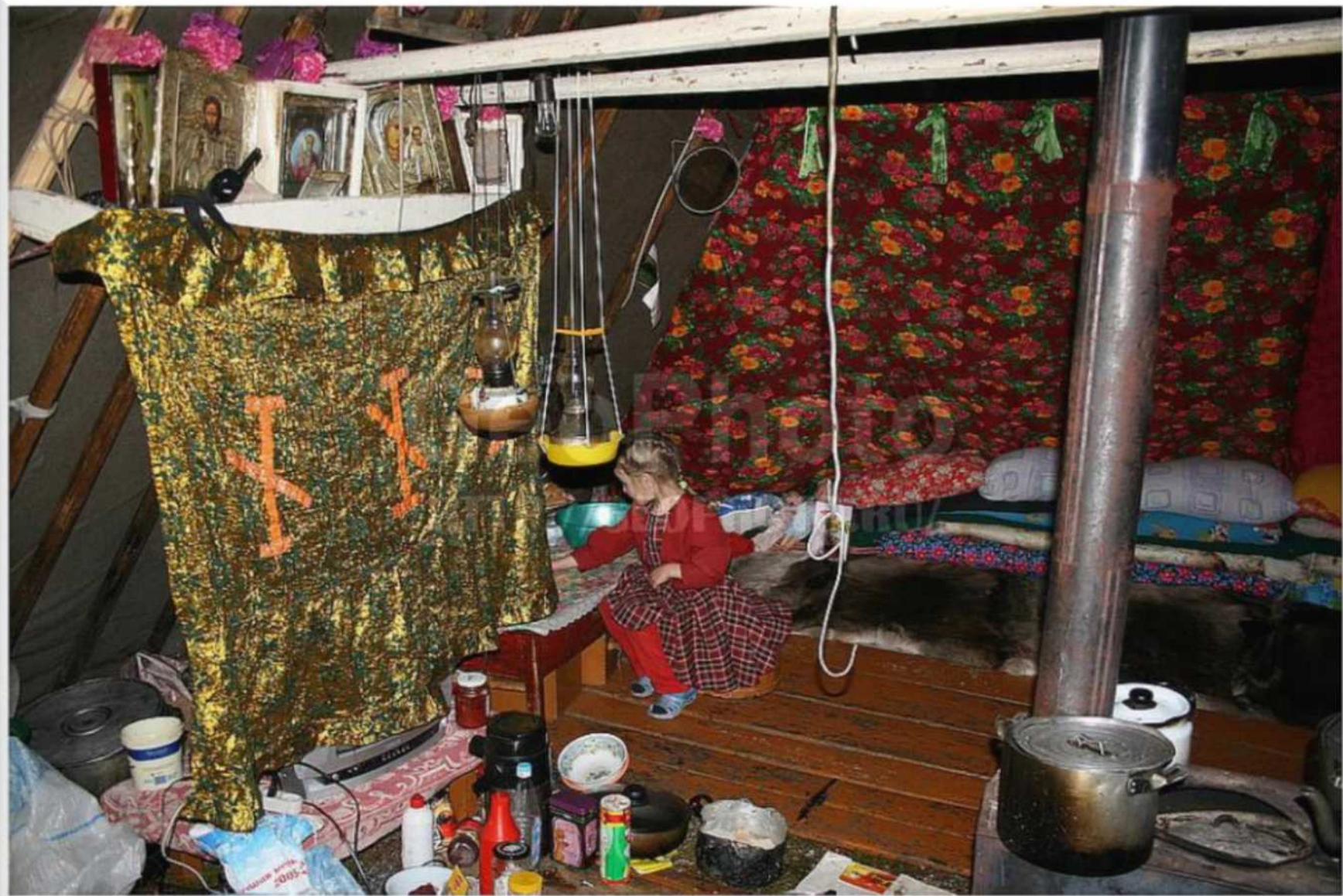
# anar838853 Koni-Zyrians camp in the tundra, Yanal, September 2018