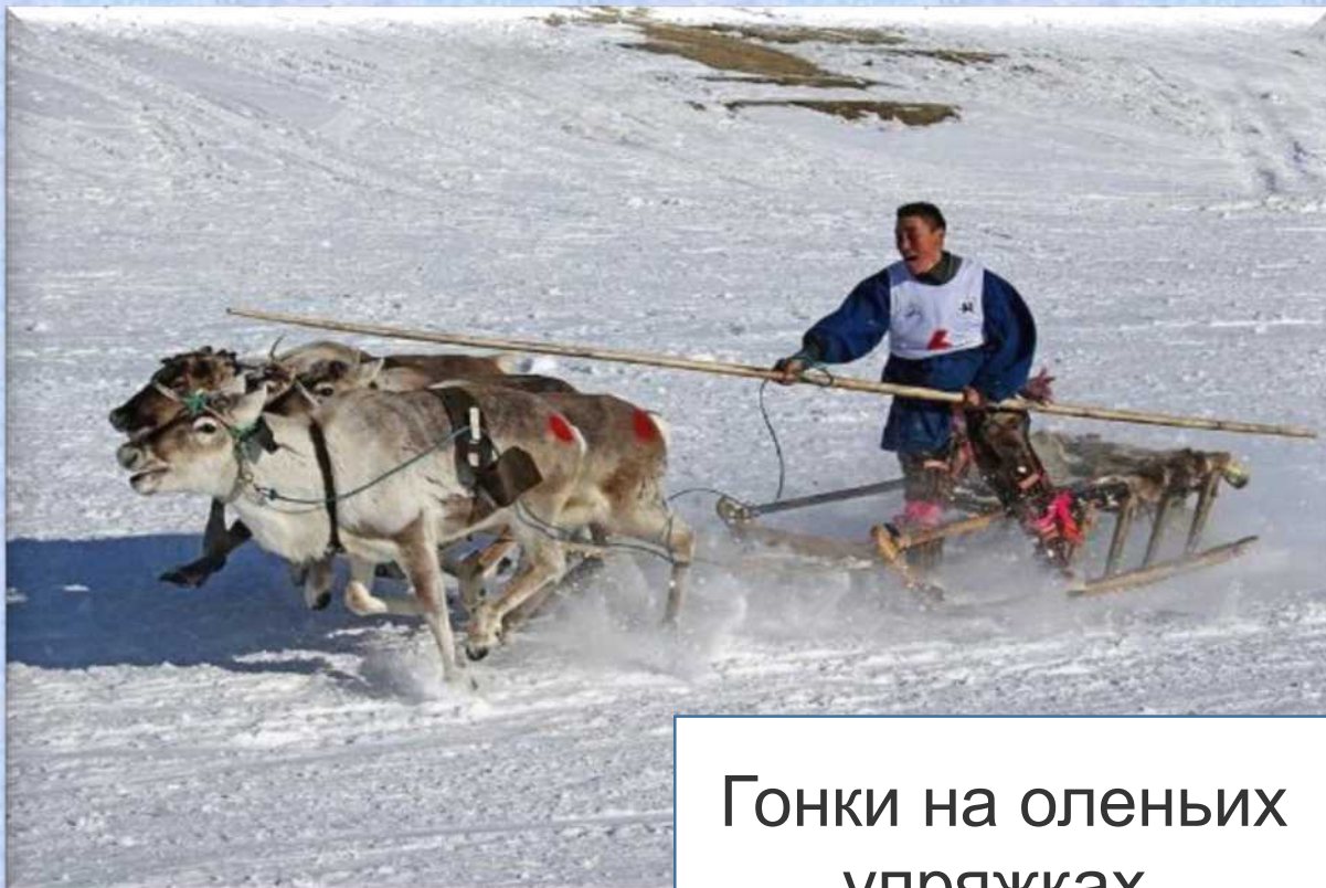
Гонки на оленьих упряжках.