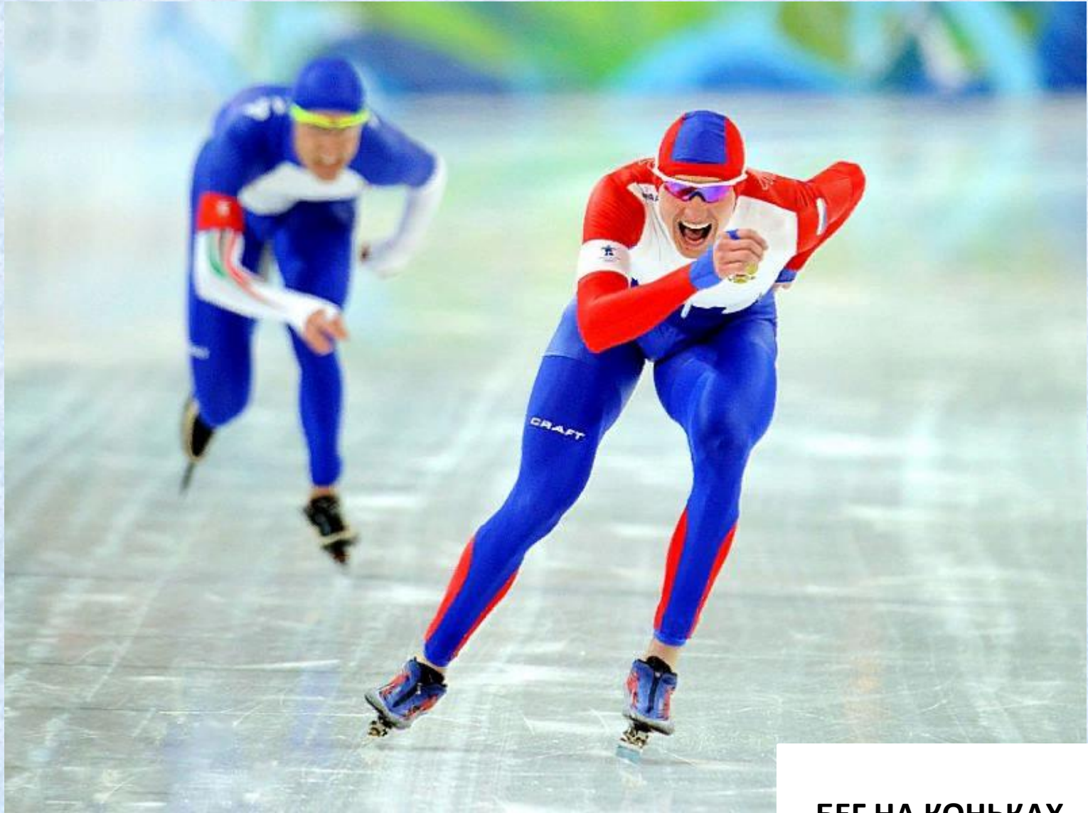
БЕГ НА КОНЬКАХ